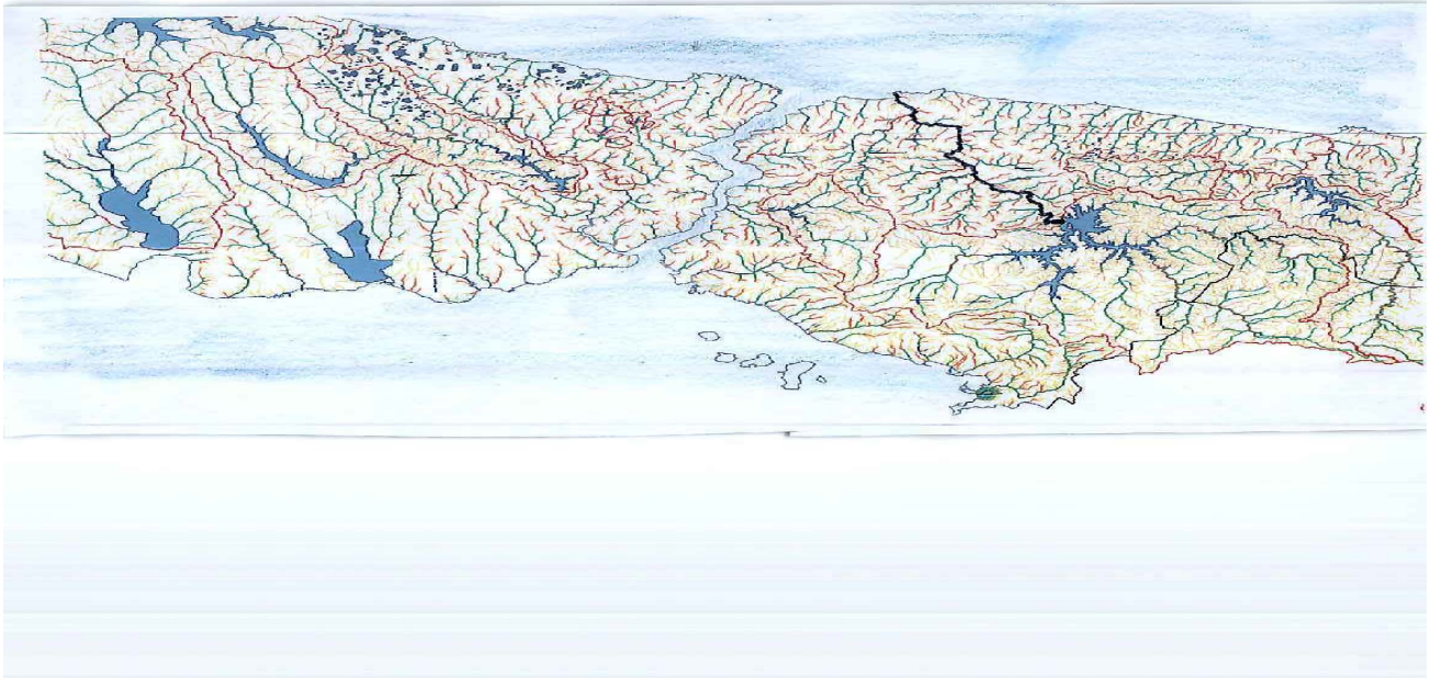
İstanbul Derelerini Gösterir Harita 1

Riva havzasının bu bölümü %75–80 oranında ormanlarla kaplıdır. Kalan bölümü ise 1.ve 2. sınıf tarım arazisi ve meralardan oluşmaktadır. Havzanın bu bölümünde bulunan 12 köyün halkı tarım, ormancılık, hayvancılık ve turizmle geçinmekte, ayrıca tesislerde işçilik yapmaktadır,